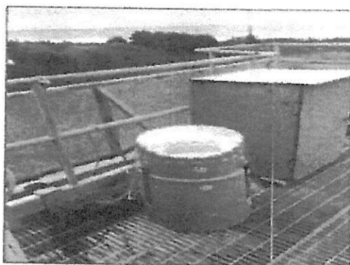
Fotografía 1: Instalación Equipo Automático